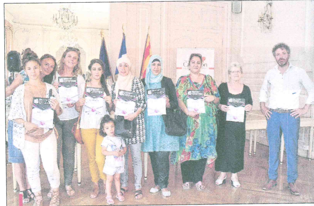
Les parents, qui ont également participé à cette initiative, ont été récompensés par C. Fontvieille.